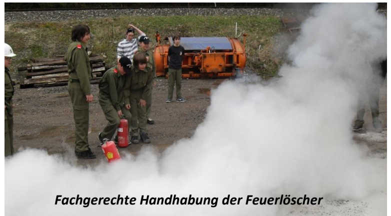
Fachgerechte Handhabung der Feuerlöscher