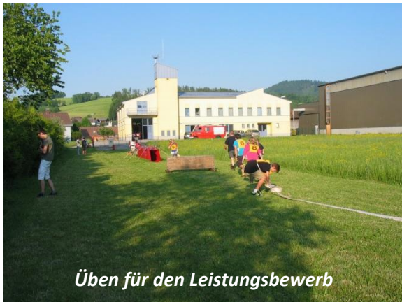
Üben für den Leistungsbewerb