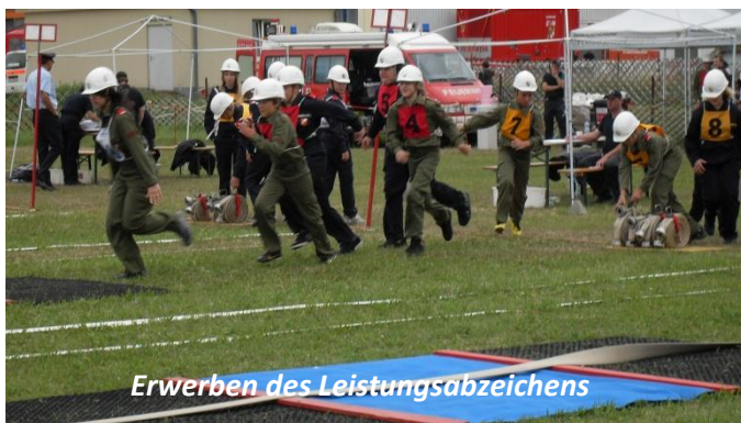
Erwerben des Leistungsabzeichens